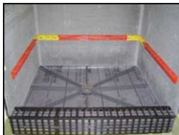
StringA-Level aproximadamente alineado.