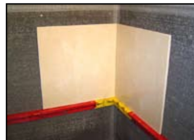
Ponga las baldosas encima del StringA-Level

Diseñado primeramente para instalaciones de baldosas, el Sistema de soporte de baldosas de StringA-Level se usa en cualquier baldosa de pared donde el embaldoso empieza por encima del piso. El sistema es un equipo de herramientas reutilizables que eliminan la pérdida de tiempo en problemas de enderezamiento o nivelación con cordones de madera. El sistema es comprendido de secciones entrelazadas con burbujas de nivelado que se usan en serie para formar un estante angulado de soporte continuo en donde la primera hilera de baldosas reposan. Las secciones están temporalmente sujetas a la pared con tornillos y arandelas que se le provee al usuario a través de múltiples ranuras en cada sección. Disponible en el equipo y en la forma componente con instrucciones ilustradas de cómo usarlo.