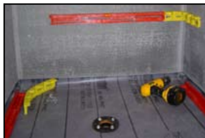
Asegure las secciones del StringA-Level a la pared